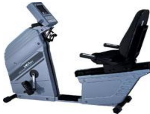
コードレスバイク