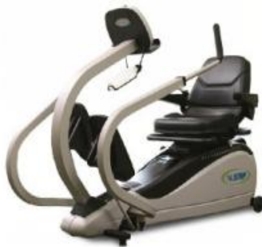
ニューステップマシン